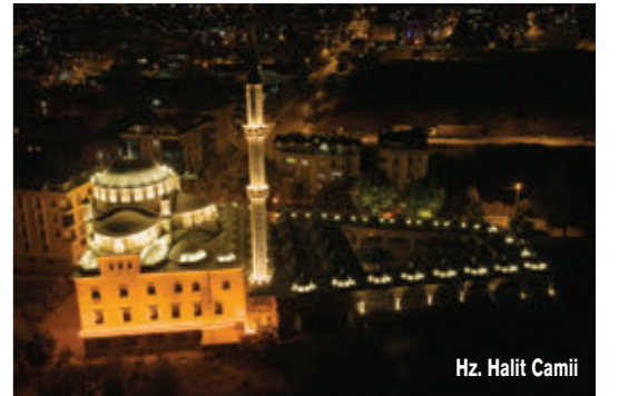
Hz. Halit Camii