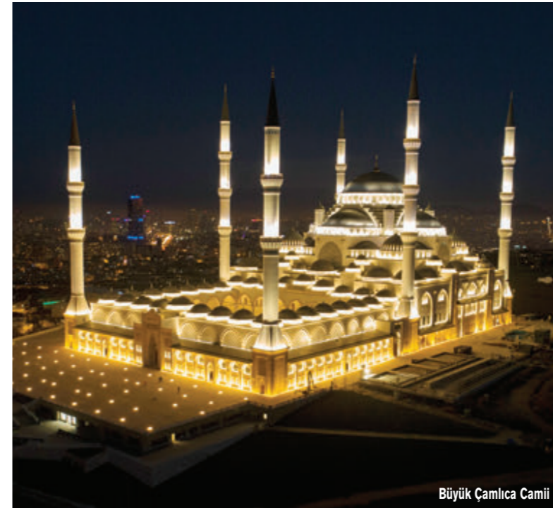
Büyük Çamlıca Camii