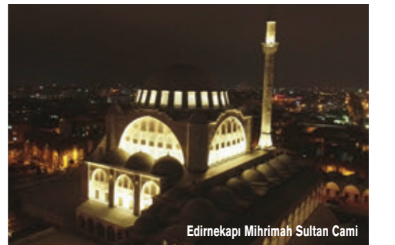
Edirnekapi Mihrimah Sultan Camii